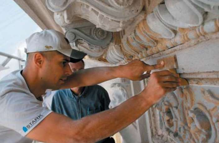
Murare som drar lister i kalkputs vid takfoten på kvarteret Hälsan 5 (byggår 1885), Tegnérsgatan i Stockholms City.