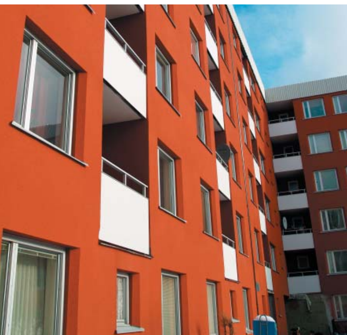
Huge Fastigheters kvarteret Logen; 25 000 kvm tilläggsisolering och putsning av fasad, balkongrenovering och ombyggnation av tak. 45-gradiga smygår släpper in mycket dagsljus trots den ökade vägg-tjockleken.