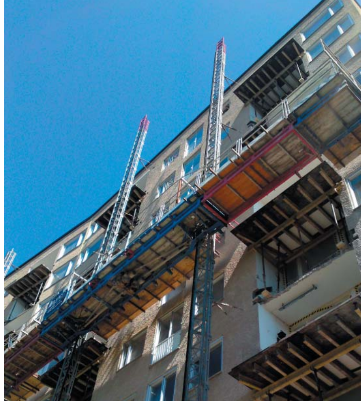
Våra mastklättrande arbetsplattformar fungerar både som materialhiss och arbetsplats åt våra murare, montörer och betongarbetare. Här får Brf Emaljeraren i Järfälla hela 70 cm djupare balkonger.

Vill ni ha en fördjupade undersökning kan vi ta hjälp i form av skyliftar och detaljgranska större problem. Undersökningen, eller åtgärdsanalysen, offereras först av oss och gör inte att ni förbind er att anlita STARK Fasadenovering vid en senare eventuell fasadenovering.